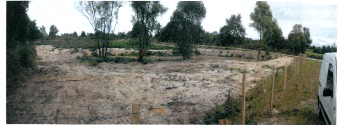
Le périmètre clôturé apparaît, en outre, sur la vue « Géoportail » citée ci-dessous.

La photographie citée ci-après illustre cette remise en état.